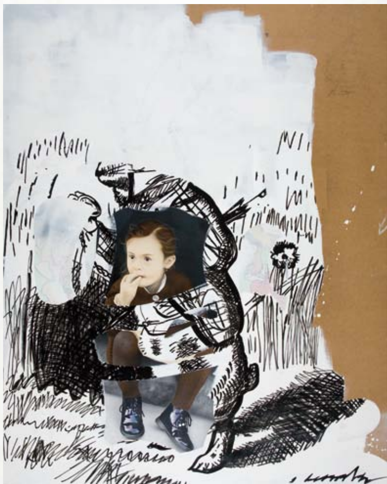
bochetto trasera Hello, kitty!

Óleo y acrílico sobre madera 150 x 120 cm 2010