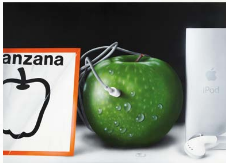
La manzana de adán y el iPod de eva (apple)

Óleo y acrílico sobre madera 70 x 90 cm 2010