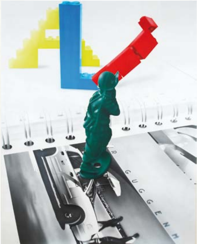
La batalla de las palabras

Óleo y acrílico sobre madera 150 x 120 cm 2009