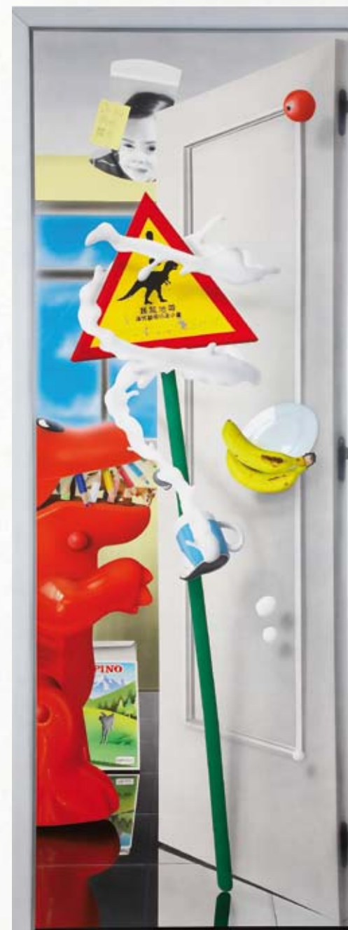
capítulo 7, UNA MERIENDA DE LOCOS

Óleo y acrílico sobre madera 204 x 81 cm 2009